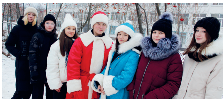
Новогодний десант свою задачу выполнил

Карина ХИСМАТУЛЛИНА.