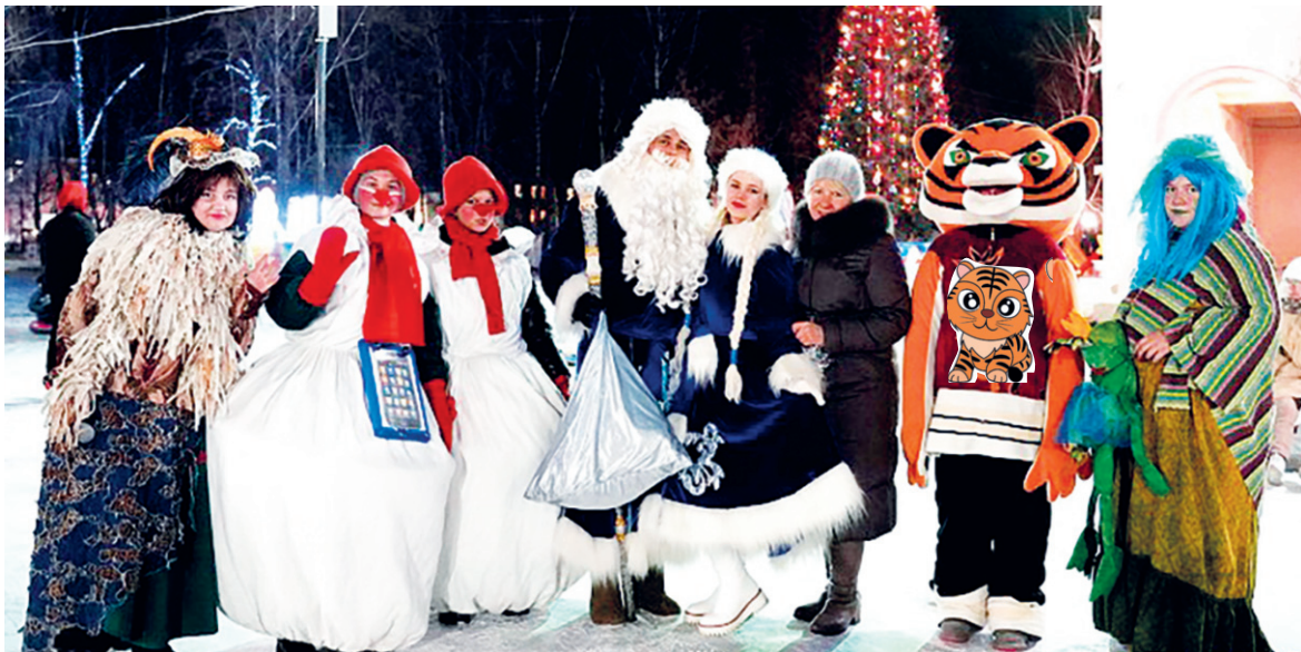
Без Кикиморы сказка будет неинтересной

Яна ЗИНАТУЛИНА.