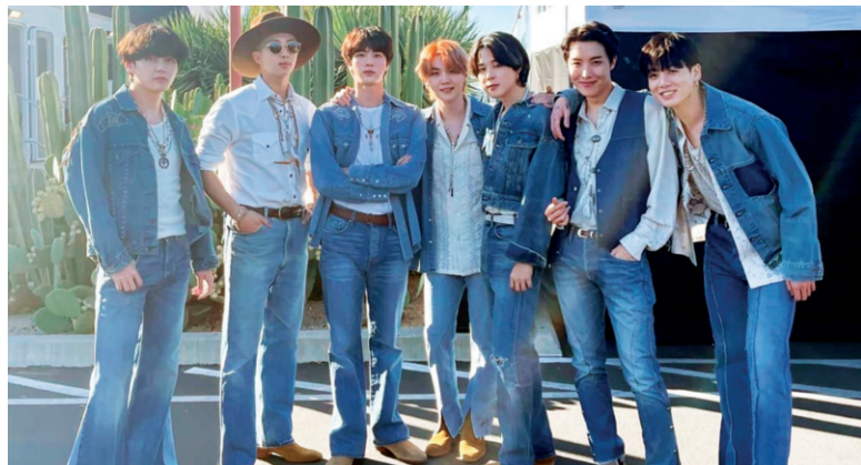
Семь чудес света

Анастасия ШЛЕМОВА.