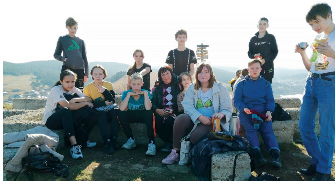
Главная смотровая площадка Усть-Катава покорена!