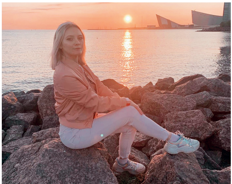
Санкт-Петербург уже три сотни лет вдохновляет и восхищает

«Я к розам хочу, в тот единственный сад,