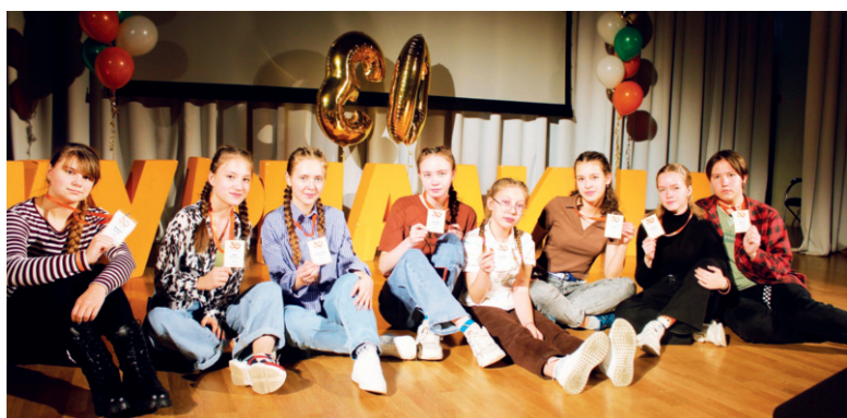
Юбилейная Журналина надолго останется в памяти бумовцев

София ГРИГОРЬЕВА.