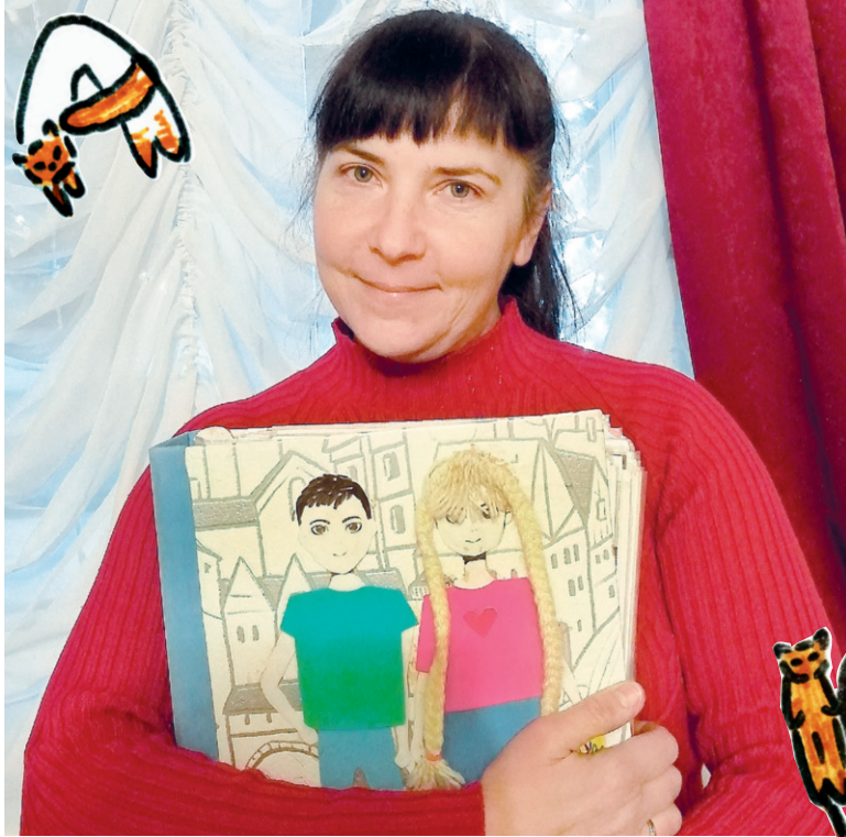
Летопись «БУМ»а теперь в наших руках