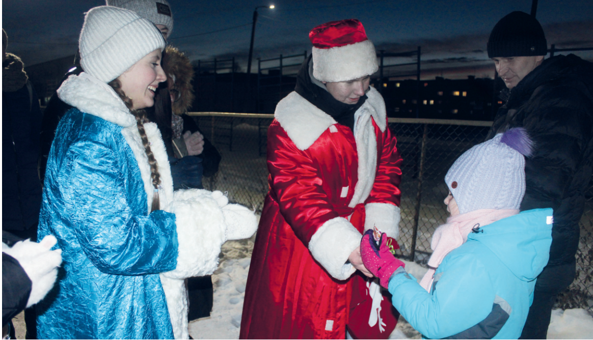
Ни один прохожий не остался без подарка Деда Мороза

Каждый ребёнок мечтает увидеть Дедушку Мороза, не правда ли? Мы знаем, что у него есть внучка Снегурочка, тройка лошадей и помощники. Они все вместе творят волшебство и дарят замечательное настроение. В этом году бумовцам выпала чудесная возможность стать помощниками Деда Мороза. А как это было, сейчас расскажу.