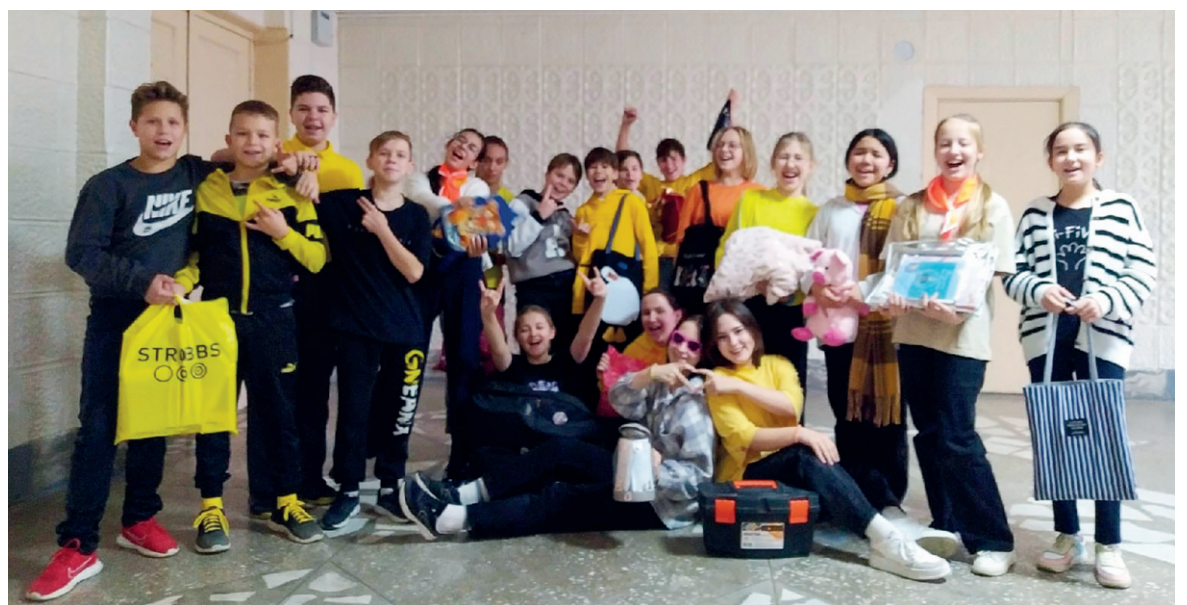
7 «А» класс надолго запомнит День в жёлтой одежде и без рюкзаков

Вы задумывались когда-нибудь о Дне рождения? Что это за день такой? Ведь этот день бывает не только у людей, но и у животных, зданий, техники. У любого предмета есть этот важный день, с которого и начинается жизнь.