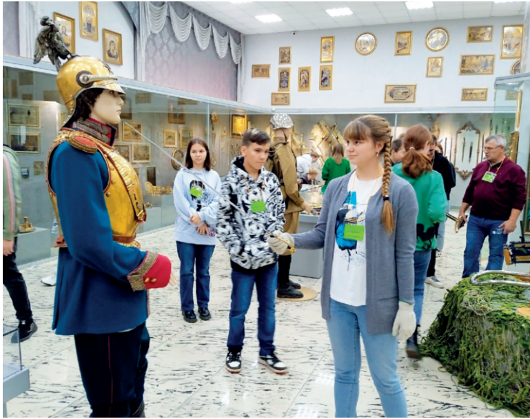
Скрестим же шпаги!

За достижения в конкурсах, соревнованиях и олимпиадах от нашей области школьникам выдаются социальные сертификаты. Они дают возможность путешествовать. Группа из шести человек, в числе которых была я, посетила город Златоуст. В течение двух дней мы знакомимся с его историей и достопримечательностями.