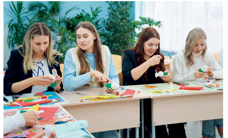
Учатся не только ученики, но и учителя