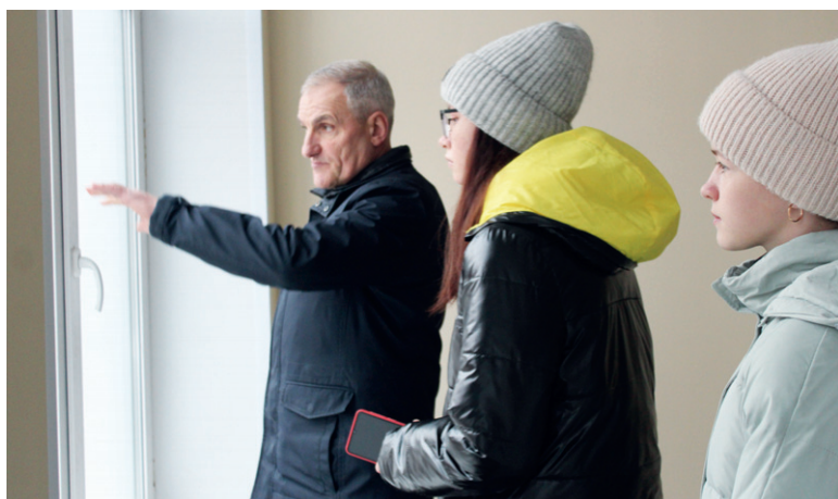
Скоро все смогут увидеть, какой красивой стала школа

Анастасия ШЛЕМОВА. Рисунок Евангелины ШКЕРИНОЙ.