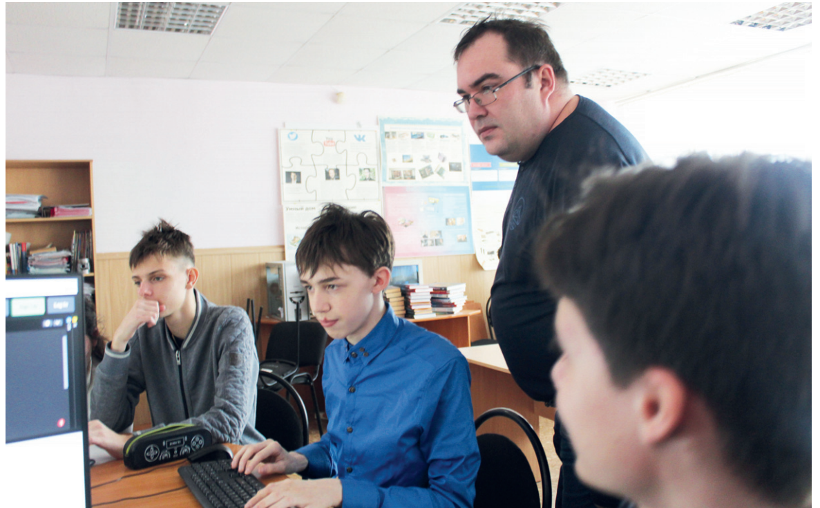
Профессиональную пробу школьники проходят под руководством педагога

Старшеклассники вытянули «Билет в будущее». Так называется Всероссийский проект по профессиональной ориентации учащихся шестых-одиннадцатых классов.