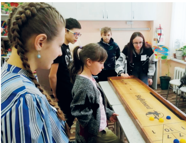
Совместные игры увлекли и нас, и ребят