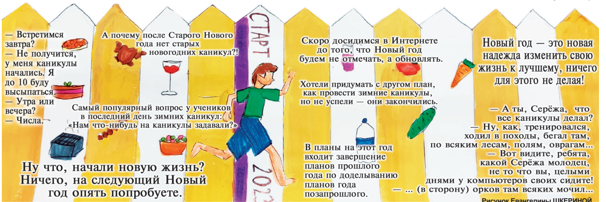
Рисунок Евангелины ШКЕРИНОЙ.

— Есть! Ты только посмотри на это! На этот ракурс, на цвет и тень, да это же просто превосходно!.. Как же... — начал было он, но вдруг остановился и скорчился от боли. Рука была сломана.