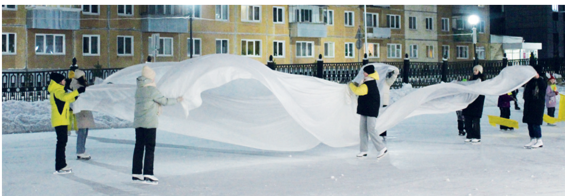
Танцевальные коллективы Дворца культуры встали на коньки