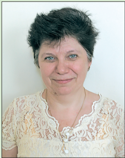
Точка зрения главного редактора