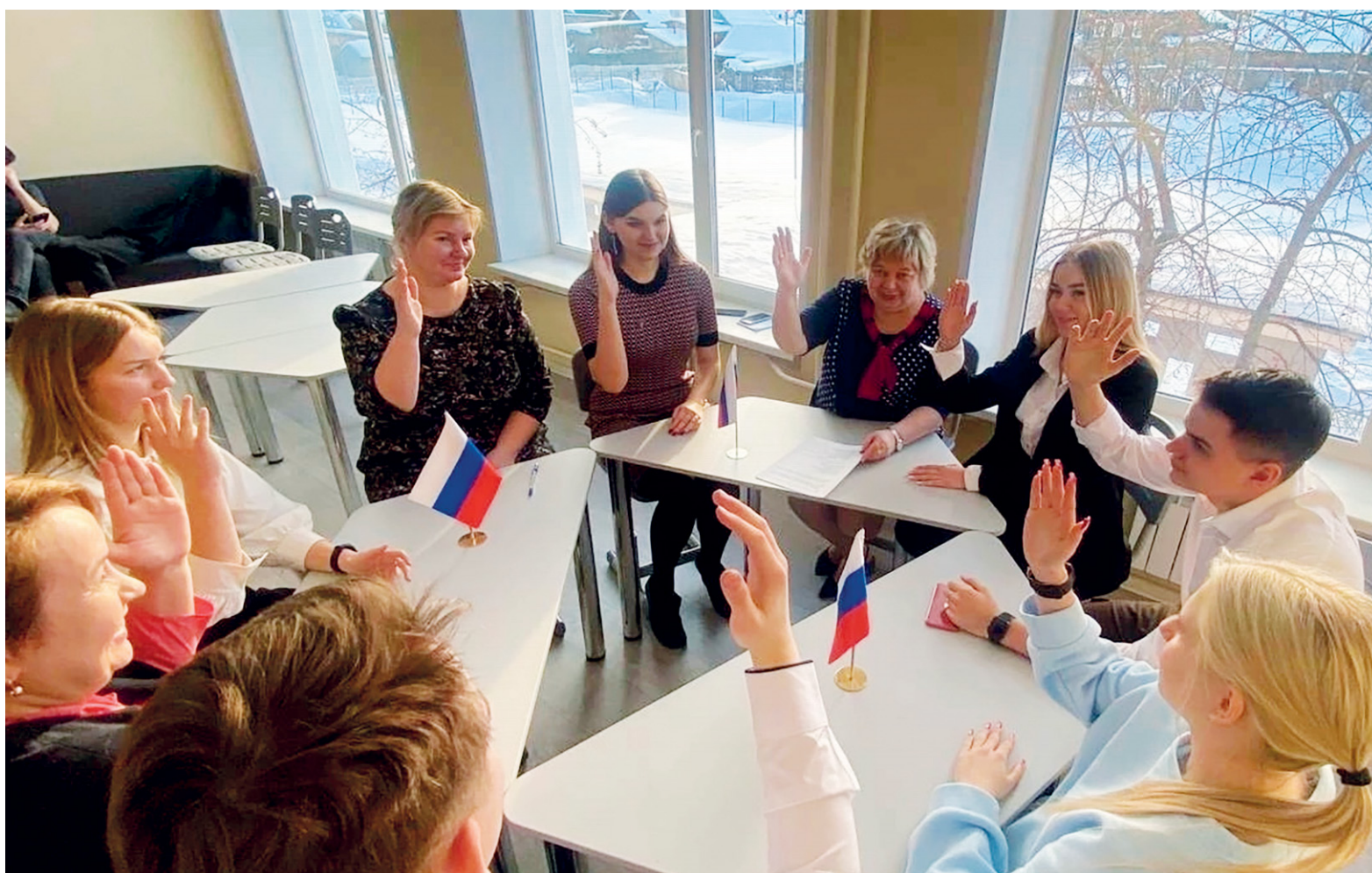
Движению Первых в школе № 1 быты!

В наше время в тренде быть самореализованным и образованным человеком. Но многим просто не удаётся найти стимул и мотивацию к достижениям. Некоторые дети боятся раскрыться в токсичном обществе. Одним не хватает поддержки, а другие вовсе не видят всех возможностей и перспектив в жизни. Чтобы помочь детям найти себя, в России появилась новая организация — РДДМ (Российское Движение Детей и Молодёжи) или Движение Первых.