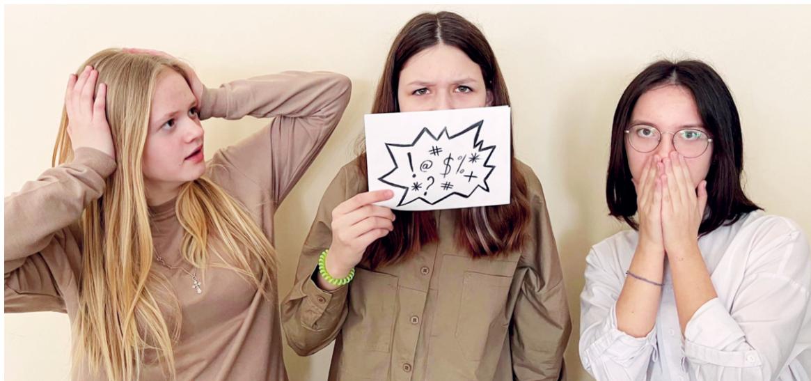
Из всего богатства русского языка лучше выбирать благозвучные слова

Вы знали, что 3 февраля отмечают Всемирный день борьбы с ненормативной лексикой? Это действительно проблема современного общества. Она проникла повсюду.