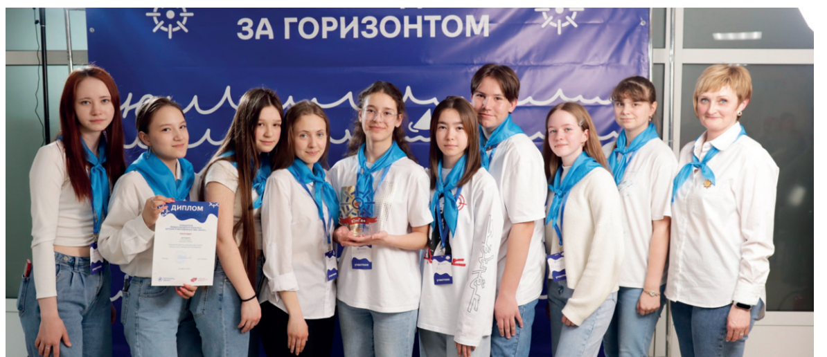
Мы — команда!