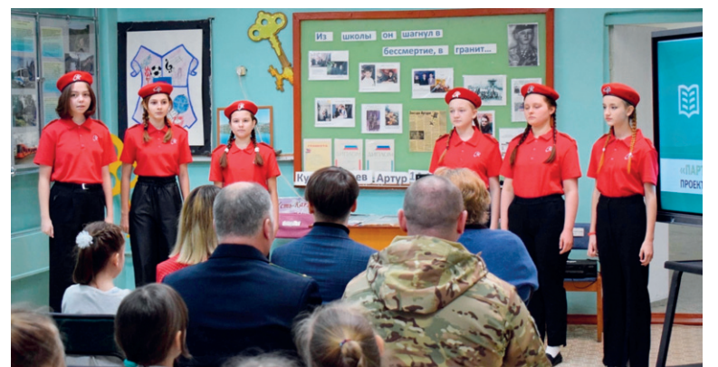
В музее МАУО СОШ № 7 появился ещё один интересный объект, а в школе — новая традиция

Ева СУЛТАНОВА.