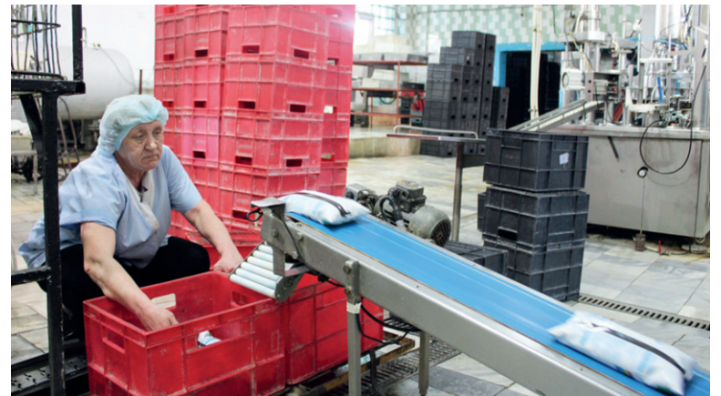
Фасовочный робот полностью не заменит человека