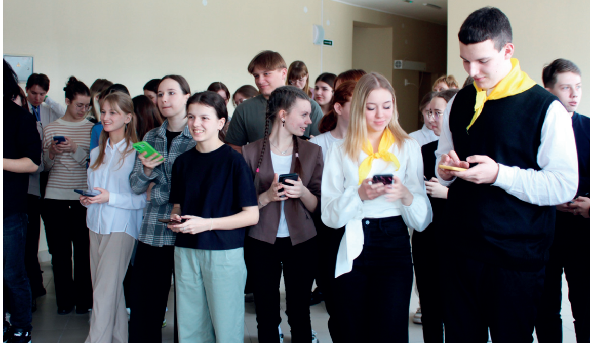
Участники интенсива не только слушали лекции, но и выполняли практические задания

В Усть-Катаве состоялось интересное мероприятие — образовательный интенсив «Молодёжь Южного Урала». Три спикера из Молодёжного ресурсного центра города Челябинска поделились своими знаниями в области студенческого самоуправления, молодёжных медиа и профилактики негативных явлений.