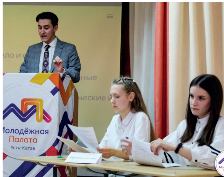
Команда «Феникс» (ГБПОУ «УКИТТ») готовится к бою с командой «Ярость» (МКОУ СОШ № 1)

Анастасия КОРНЕЕВА.