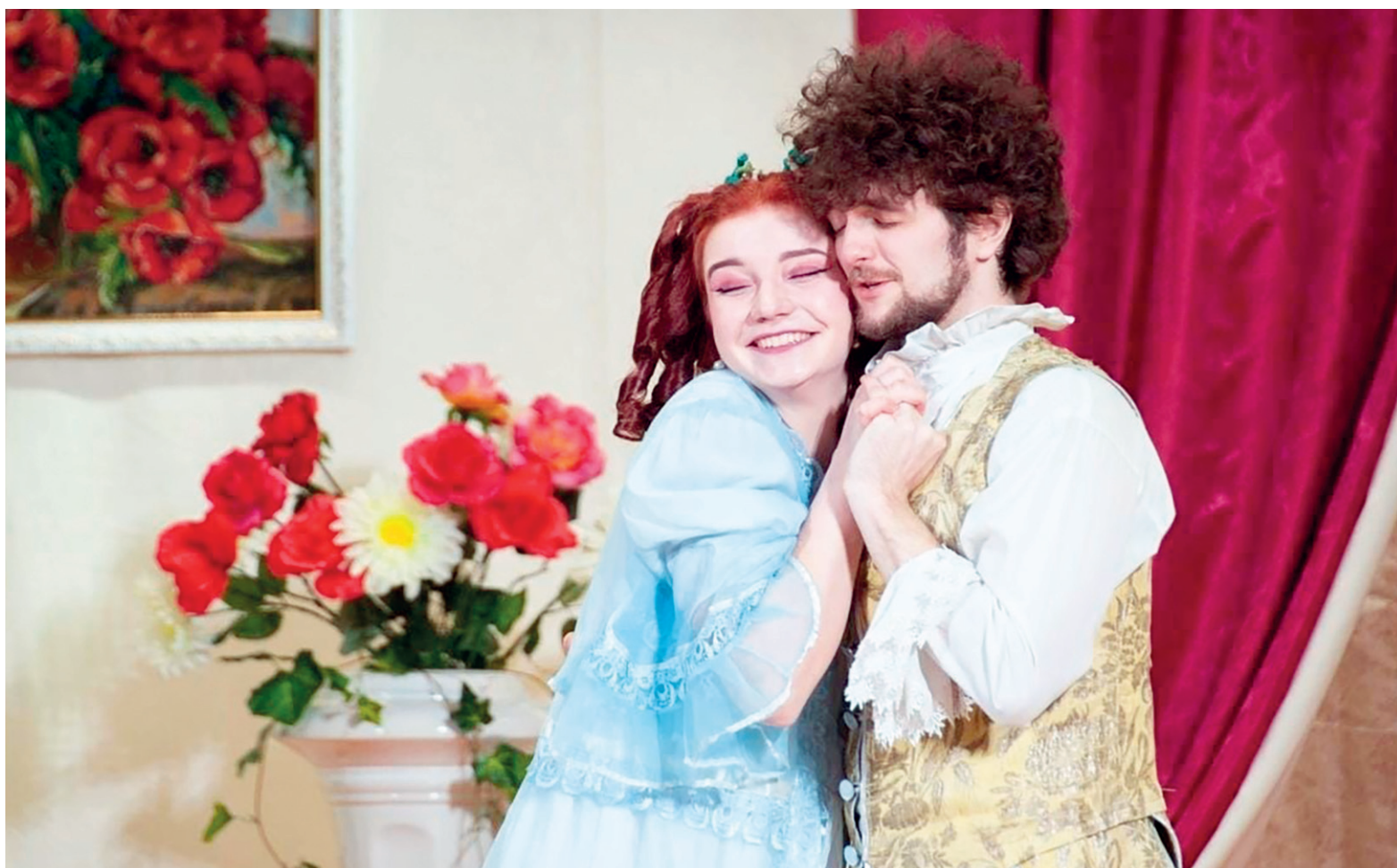
Театр для актёров — это всё: и жизнь, и слёзы, и любовь

Прекрасный месяц — март. Я думаю, он и у вас ассоциируется с началом чего-то светлого и нового в году: природа оживает, становятся зелёными поля и леса. А для артистов театра это самое насыщенное время, ведь март в России объявлен месяцем театрального искусства.