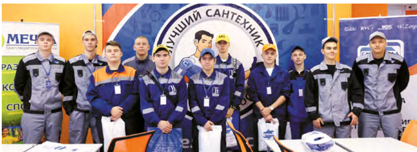
Участники чемпионата «Я на старте!»