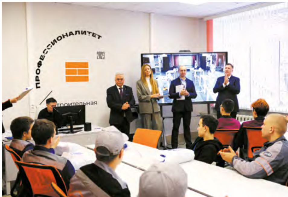
Открытие чемпионата «Лучший сантехник Я на старте!»