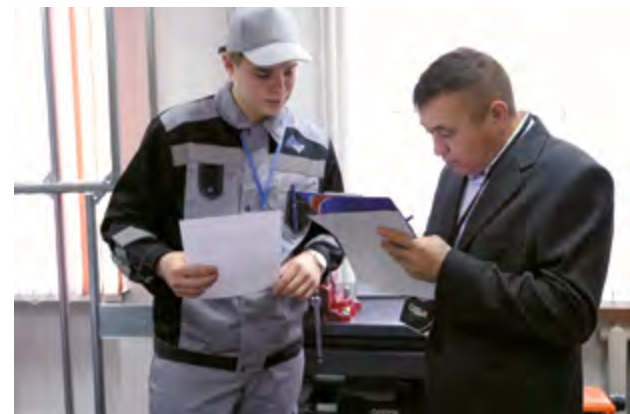
Оценивание выполнения практического задания