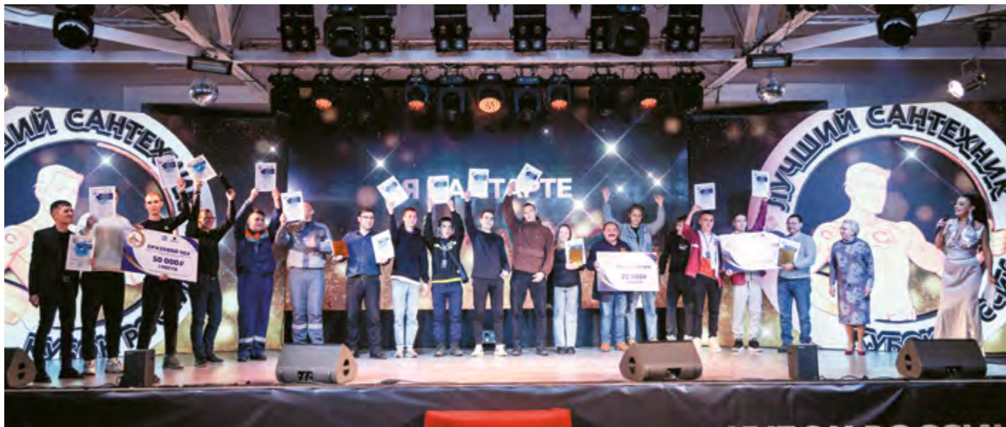
Торжественное закрытие. Команда ЮУрГТК - победитель!

23 ноября 2023 года в рамках финала чемпионата профессионального мастерства «Лучший сантехник. Кубок России» на базе нашего колледжа состоялся межрегиональный конкурс «Я на старте!» среди студентов учреждений среднего профессионального образования УрФО. В чемпионате приняли участие шесть команд из Свердловской, Тюменской и Челябинской областей.