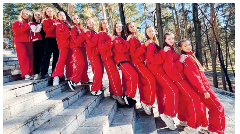
Участники конкурса «Марафон талантов»

Областного народного конкурса «Марафон талантов»! Хореографический коллектив «Колибри» прошёл в финал по решению жюри, а «Юла» — благодаря народному голосованию. Наш коллектив собрал наибольшее количество зрительских голосов — 2004. Огромное спасибо всем, кто голосовал. Это были самые разные эмоции: естественно, волнение, когда стоишь за кулисами и ждёшь своего выхода. Адреналин в момент голосования, ведь нужно быстрее распространить ссылку, чтобы получить как можно больше голосов. Ну, и, конечно, когда узнаешь результат и понимаешь, что прошёл в финал конкурса — радость, ведь попасть в него было сложно. «Юла» уже принимала участие в «Марафоне талантов» в 2022 году, дошла до финала и