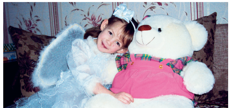
Мой плюшевый друг