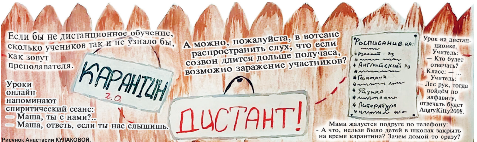
Рисунок Анастасии КУПАКОВОЙ.