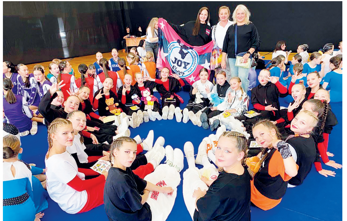
Спортсменки в ожидании результатов