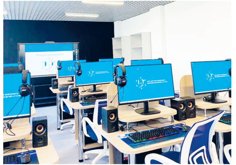
В IT-кубе всё готово к началу занятий

В IT-кубе ребята узнают о различных направлениях этой сферы и смогут выбрать то, что им больше всего интересно. Они научатся создавать игры, сайты, приложения для мобильных устройств или будут заниматься программированием роботов. Это помо-