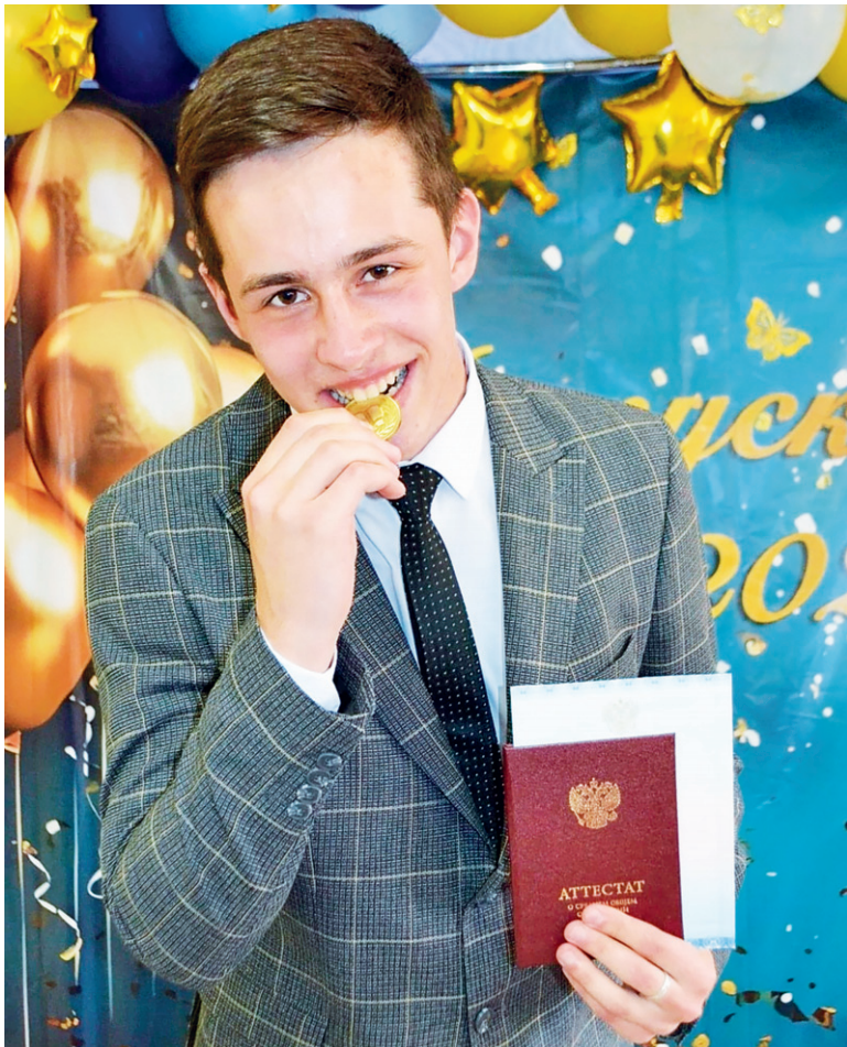
Золотой медалист отлично понимает, что значит грызть гранит науки