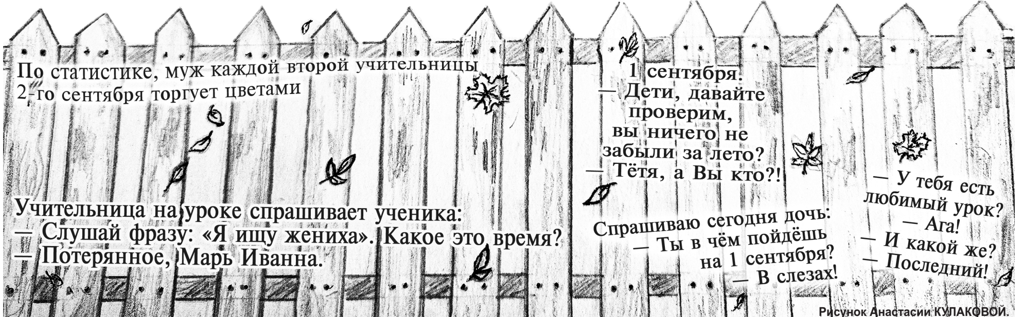
Рисунок Анастасии КУЛАКОВОЙ.