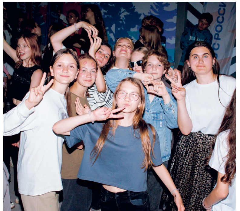
Дисотека в лагере — самое любимое событие вечера

Ангелина ЗАКИРОВА. Фото из личного архива автора.