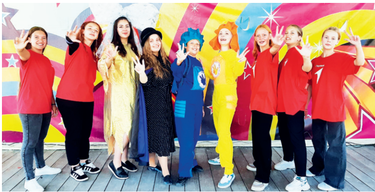
Фиксики открыли дверь в мир знаний для городской детворы