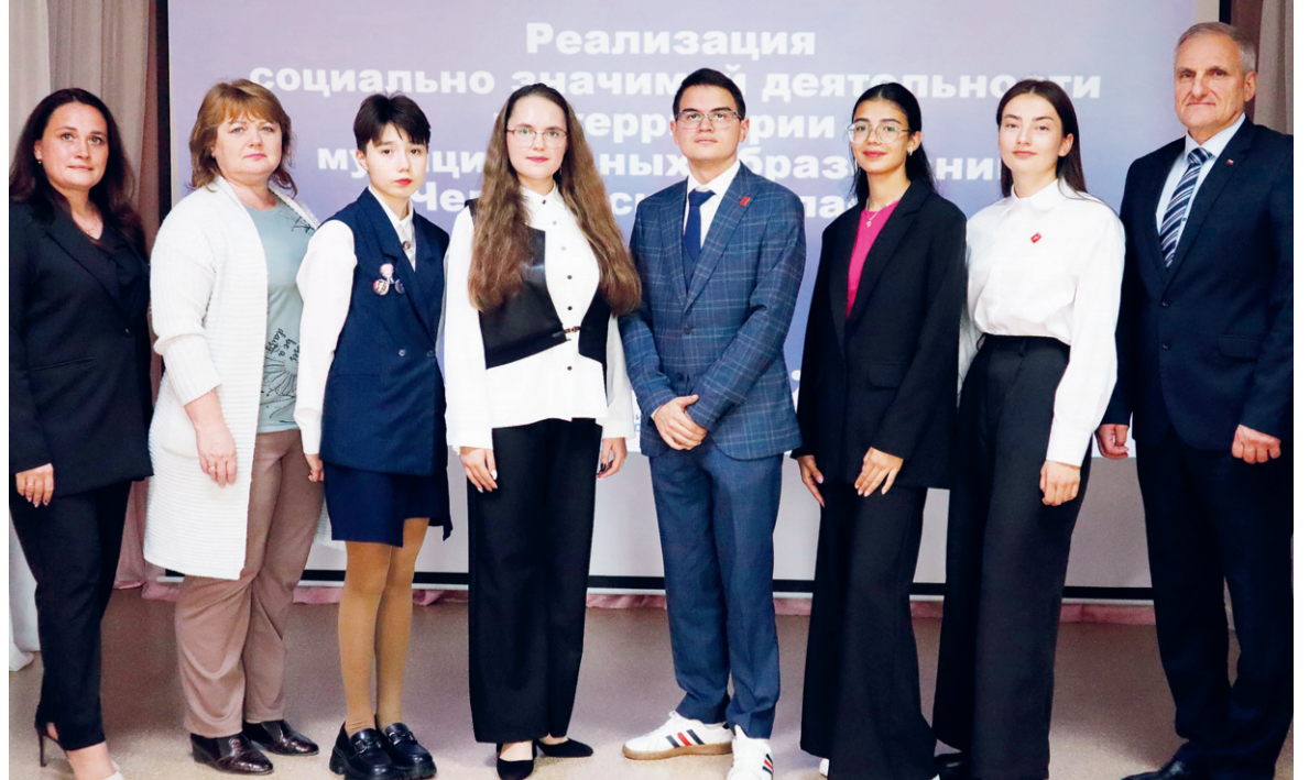
Участники проекта «Юный глава» с членами жюри

А вам когда-нибудь приходила в голову идея о том, как жители