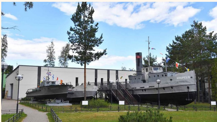
Музей на Ладожском Озере - «Дорога жизни»

Но помимо таких известных мест есть менее популярные, но не менее интересные для посещения как в одиночку, так и всей семьей!