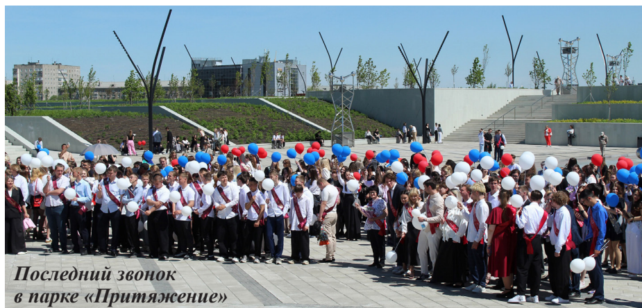
Последний звонок в парке «Притяжение»

С 2021 года в Магнитогорском педагогическом колледже можно получить школьный аттестат основного общего образования, дополненный углубленными знаниями в рамках выбранного профиля.