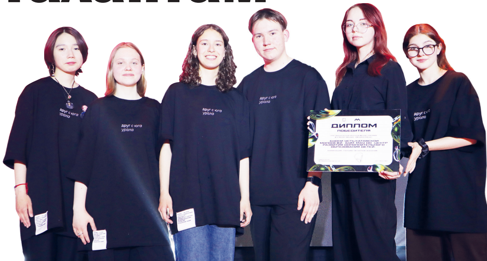
Абсолютные победители I региональной молодёжной премии «Медиасреда»