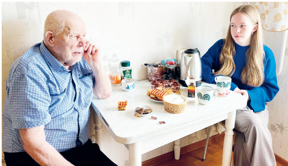
Анатолий Николаевич с удовольствием общается с молодёжью

Дарья СКРЯБИНСКАЯ.