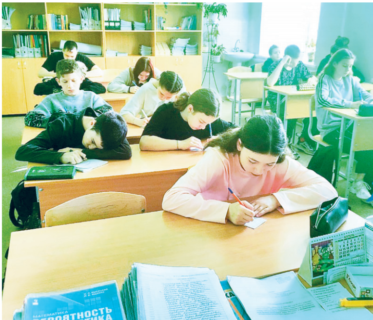
Тишина, сосредоточенность... ВПР в самом разгаре

Вместо английского мы писали ВПР по физике, хотя всё время готовились к английскому. Думали — ошибка, а оказалось, что утвердили физику. Пришлось быстро перестраиваться на другой предмет, решать задания вообще другого плана. Но многие вздохнули.