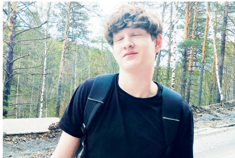
Прогулка в хорошую погоду — что может быть приятнее