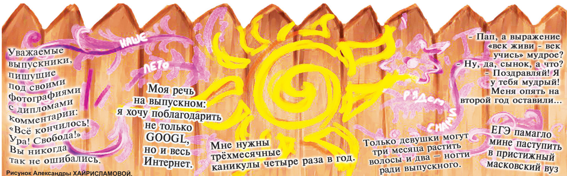
Рисунок Александры ХАЙРИСЛАМОВОЙ.

vk.com Усть-Катавская молодежная газета "БУМ"