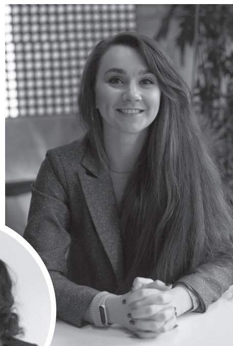
↑ 2025. В студии радио «Шансон», Москва.

На исследование шансона и работу с артистами трачу много