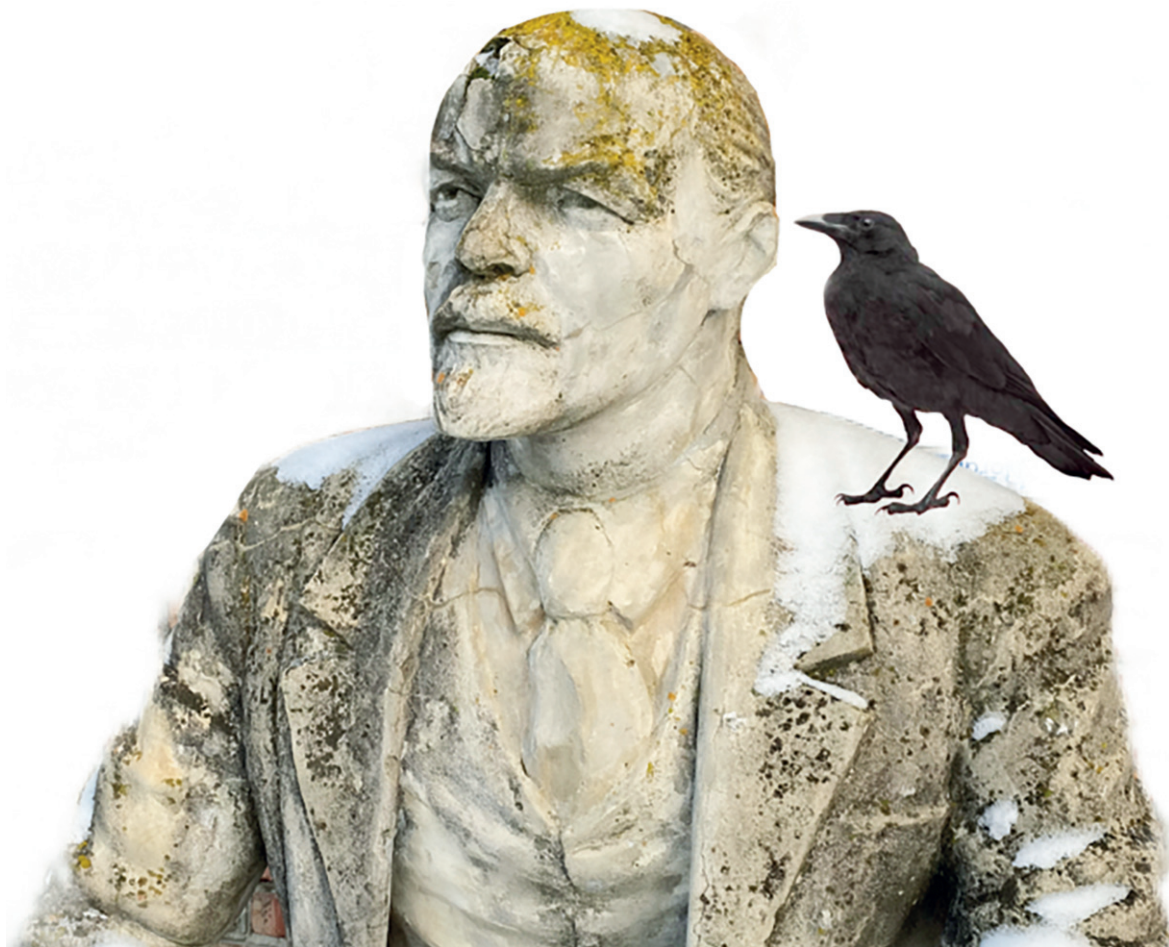
Товарищи! Да здравствует рыночная экономика!

Ленина находится под охраной старого трактора и под крылом капающих на него талой водой сосулек. Его голова проросла коричнево-жёлтым мхом, а изящный пиджак почернел то ли от старости, то ли от шлаковой пыли. Лидер под покрывалом из снега по-прежнему держит в своих руках карандаш и тетрадь. Когда-то памятник стоял у здания горисполкома*. Он перекочевал от бывшего здания администрации к кооперативному дому. Вокруг него высаживали клумбы, и вся его жизнь — весна. Но судьба распорядилась иначе: от шлакоблочного цеха до сарая, от сарая до пункта вторсырья в Шубино. Но мало того, теперь он не местная достопримечательность, и вокруг него больше не сажают цветы. Он стал объектом для достижения коммерческих целей.