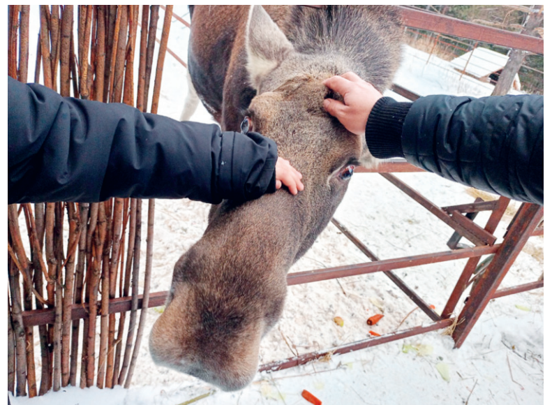
Гостеприимный лось встречает посетителей

Анастасия КУЛАКОВА.