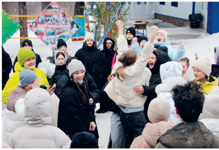
Если и есть место, где все счастливы, то это «Ребятчя»

четвёртого отряда зимней смены 2025 года: