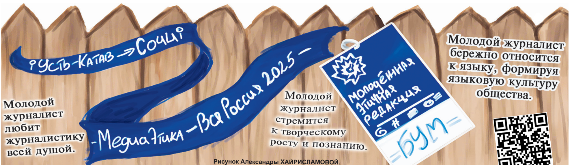
Рисунок Александры ХАЙРИСЛАМОВОЙ.

vk.com Усть-Катавская молодежная газета "БУМ"