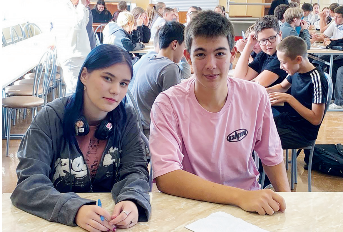
Кто? Зачем? Почему? На вопросы отвечают знатоки

— В детстве я смотрел передачу «Что? Где? Когда?», мечтая стать игроком, а в прошлом году впервые поучаствовал в ней как запасной. И вот попал в основной