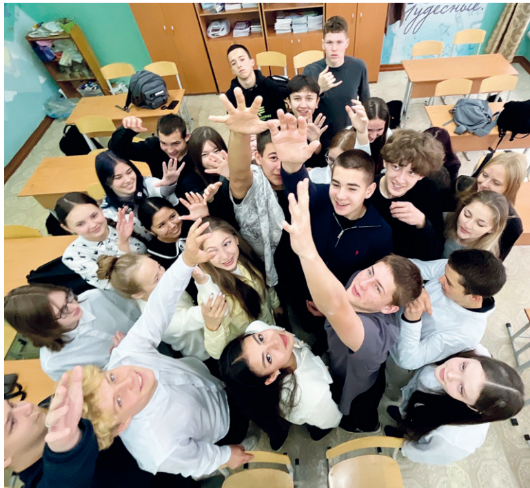
Для профильного десятого класса наступило время перемен и новых знакомств