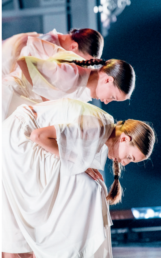
«Тесто. Точка. Ретроспектива»