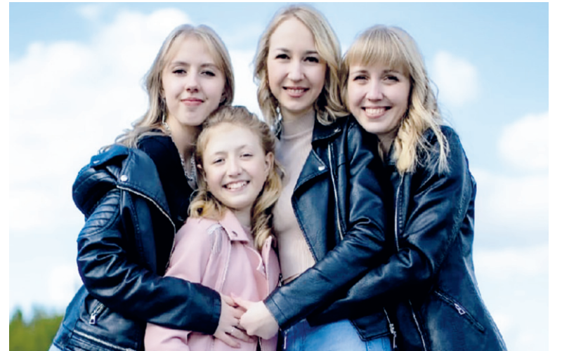
Семья. Где не заканчивается любовь