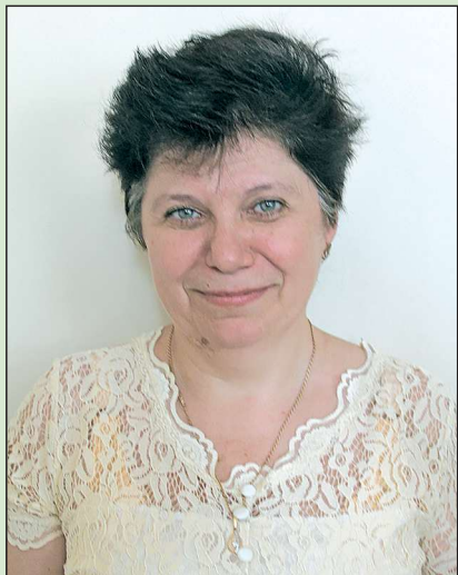
Точка зрения главного редактора